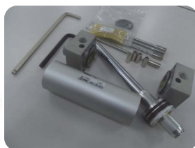
機器分解キット 実践編