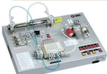
回路実習キット 入門編・実践編