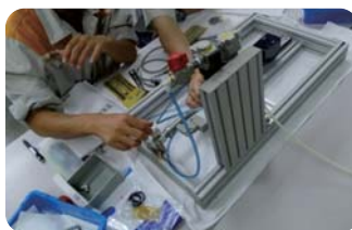
システム組み付けキット 実践編