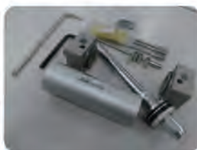
機器分解キット 実践編