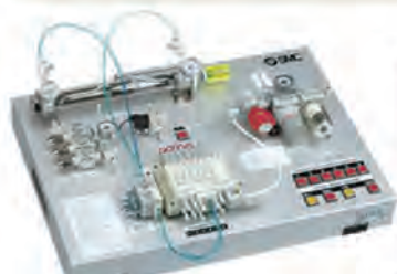
回路実習キット 入門編・実践編