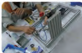
システム組み付けキット 実践編