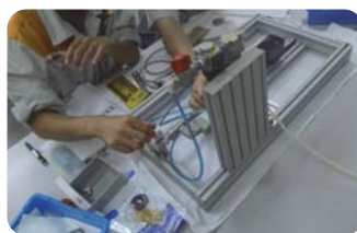
システム組み付けキット 実践編