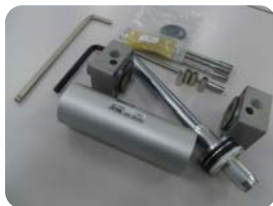
機器分解キット 実践編