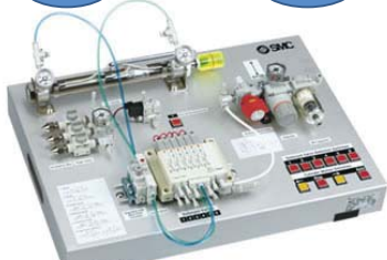
回路実習キット 入門編・実践編