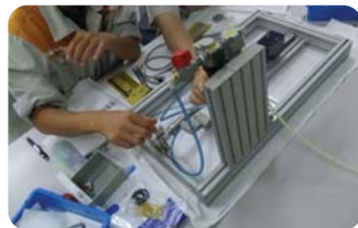
システム組み付けキット 実践編