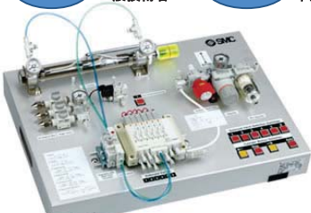
回路実習キット 入門編・実践編