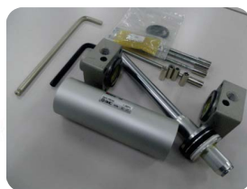
機器分解キット 実践編