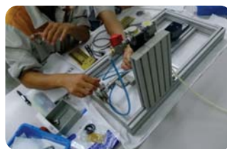
システム組み付けキット 実践編