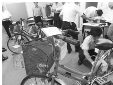
(エフ付の実習風景)