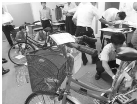
(エフ付の実習風景)